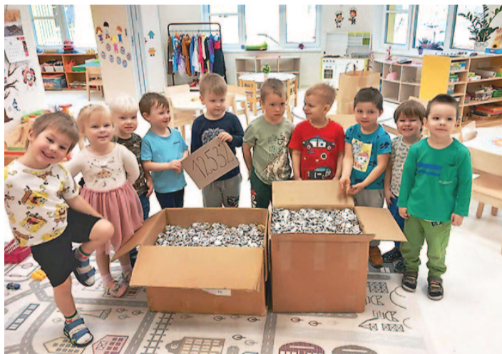
Siidisabad koos kogutud küünlaümbristega.