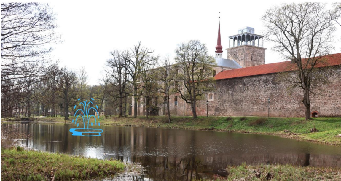
Valgustatud purskkaevu eeldatav asukoht

Purskkaev moodustab harmoonilise sümbioosi rajatava kallasrajaga, mis ühendab kaks jõekallast (Suurest sillast Parvei sillani) atraktiivseks jalutus- ja puhkealaks ning suurendab piirkonna miljööväärtust. Siin on võimalik nautida vee ja valguse mängu sellisel kujul, nagu see vaid Eesti ainsale jõelinnale omane on.