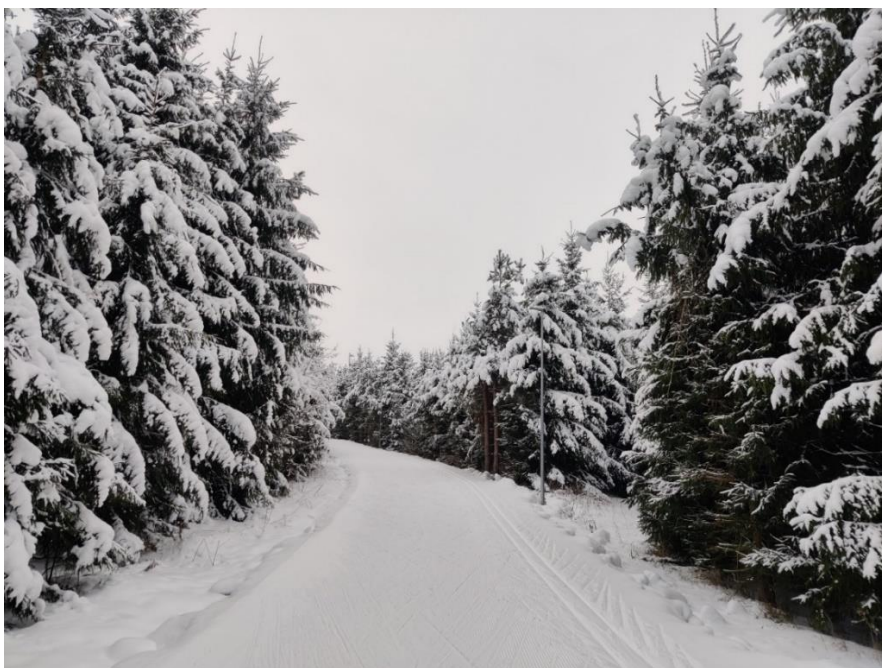
Foto 1. Vaade suusaradadele 2023. aasta detsembris.

Planeeringuala olemasolev olukord on toodud joonisel 3.