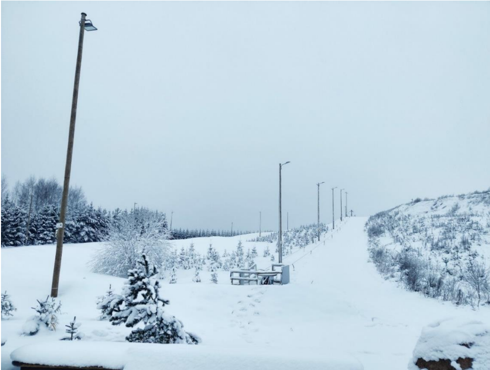
Foto 2. Vaade mäesuusa- ja lumelauamäele 2023. aasta detsembris.