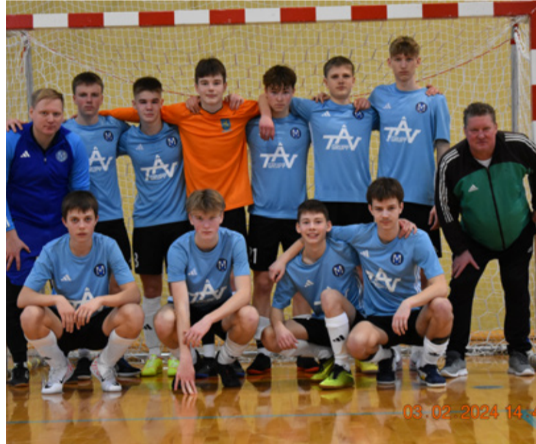
seejärel suudeti ligi saja pealtvaataja toetusel võita pingeline matš

Põltsamaa meeskonna kaks viimast miniturniiri toimusid koduses Felixhallis. 3. veebruaril mängiti esmalt FC Kose vastu 2:2 viiki ja hiljem väga tähtsaks osutunud mängus võideti lõpuminuti väravast Narva United FC 1:0. 1. märtsil alustati kindla 5:0 võiduga Põlva FC Lootose üle ja