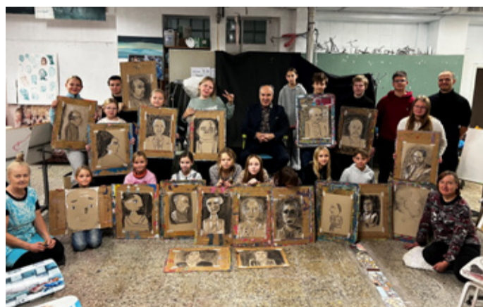
Õpilased ja nende valminud tööd koos modelliga.