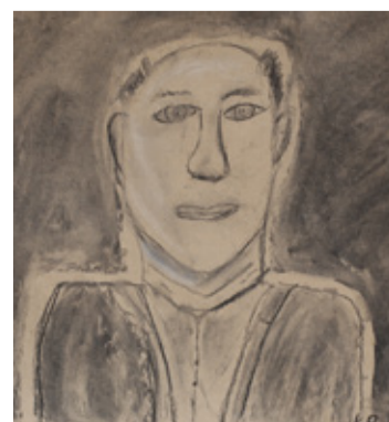
Autor: Kristelle Petrov