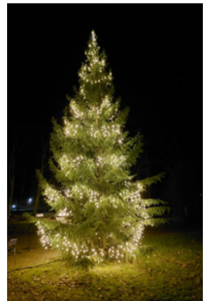
Puurmani jõulukuusk tulede säras.