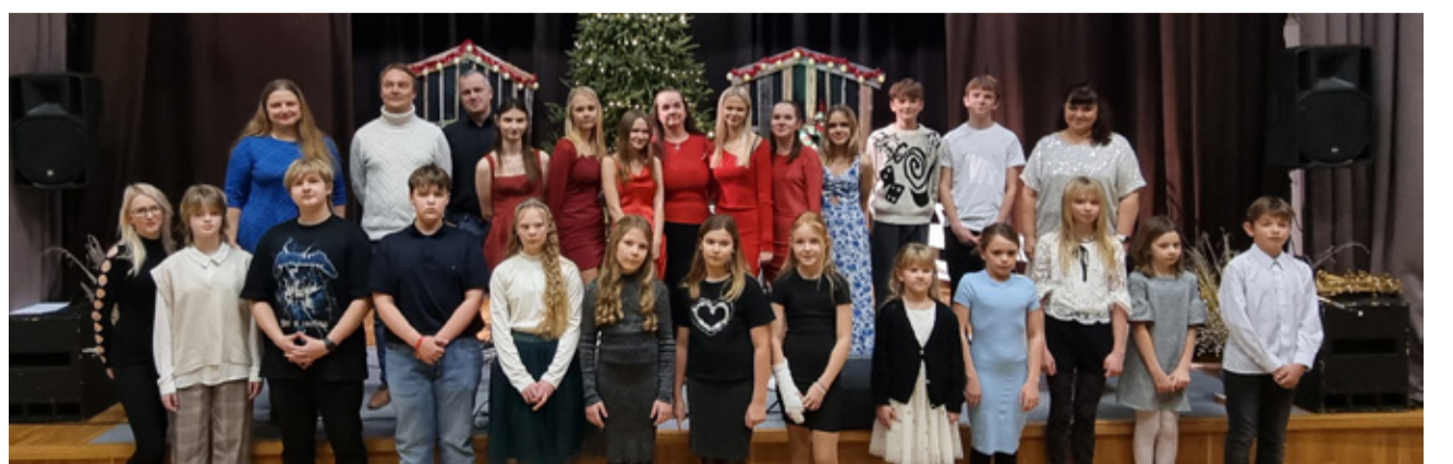
Puurmani Muusikastudio lõpetas aasta talvekontserdiga.