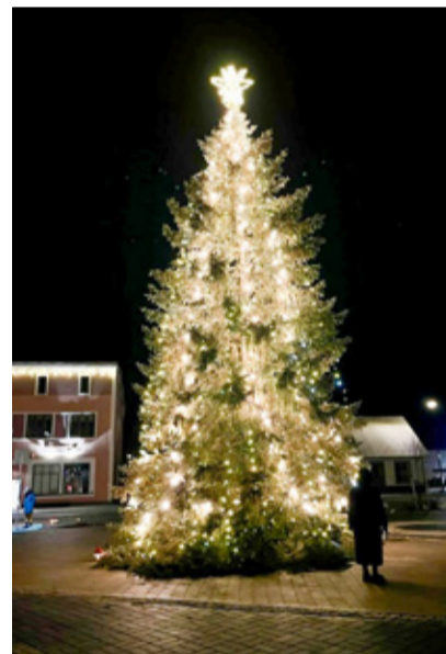
Põltsamaa jõulukuusk eredal säramas.