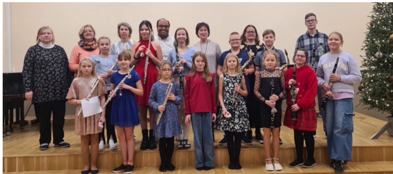
9. detsembril Põltsamaa ja Jõgeva Muusikakooli ühiskontsert „Vahvad viisid“.