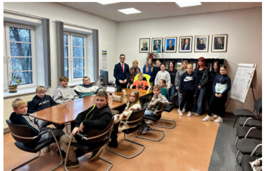
Põltsamaa Ühiskooli 6.b klassi õpilased vallavanemaga tunnis.