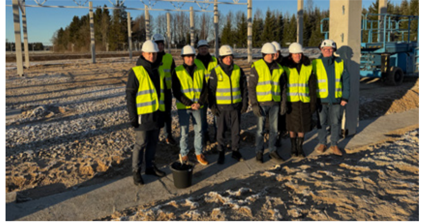
ESPAK-i kauplusehoone sai nurgakivi.