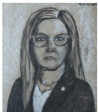
Autor: Merili Alliksaar