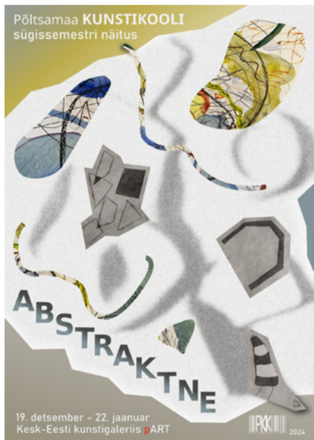
Kunstikooli näitus „ABSTRATKNE“. Avatud 19.detsember – 22. jaanuar Kesk-Eesti kunstigaleriis pART.