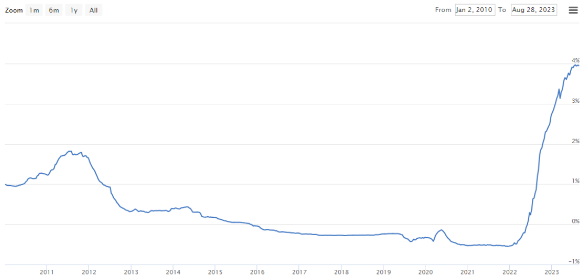
Euribor 6 months

Majandusele avaldab olulist mõju ka laenuintresside tõus, mis on seotud Euroopa Keskpanga intressimäärade tõstmisest tuleneva Euribori tõusuga. Kui 2022. aasta alguses oli 6-kuu Euribor negatiivne (-0,539%), siis 2023. aasta alguses oli see juba 2,732% ning käesolevaks ajaks on jõudnud 3,95%ni (joonis 1). Prognooside kohaselt ületab 6-kuu Euribor 2024. aastal 4%lise määra, langedes oodatavalt 2025. aastal 2%ni ( allikas: The Economy Forecast Agency https://longforecast.com/euribor-forecast-2017-2018-2019 ).