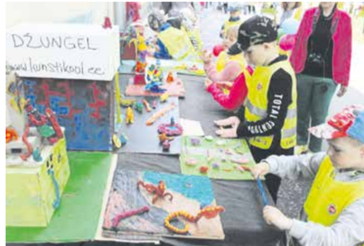
Pärast koroonapausil olekut naudivad lapsed ühiseid ettevõtmisi väga. Foto lastekaitsepäevalt.

Meie lasteaia töö tõepoolest hakkaski toimima. Alguses võis tunduda, et üle kivide ja kändude, kuid andsime aega kõikidele kohanemiseks. Osa lapsevanemaest olid vastupidisel arvamisel, küsides, miks ei toimi asjad nii, nagu olid toimunud. Nad ei kujuta ette siamaani, kui palju õppekohtadega peab juhtkond tegelema, et kõik sujus ladusalt. Kogu süsteemi käivitamine ei ole hetkel juhtkonna ainus töö. Uue lasteaia valmimisega peavad nad samuti iga päev kursis olema. Vaatamata keerulisele ajale on juhtkond ikka särasilmne, töötajad on tegusad, rõõmsameelsed ja suunavad