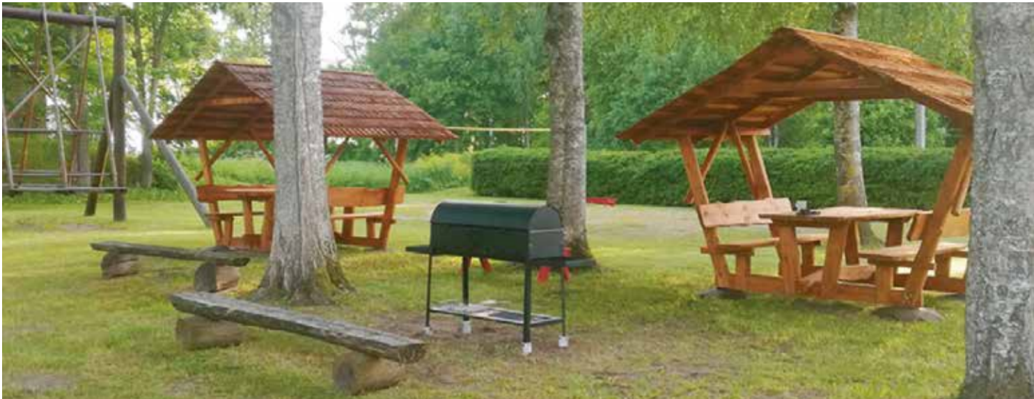
Kaasava eelarve toel kerkisid Tapiku külaplatsile varikatusega laud ja loodi grillimisvõimalus.