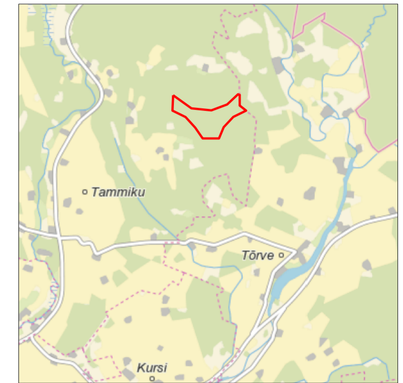
Kaardileht nr 5434 Puurmani, 6412 Jõgeva