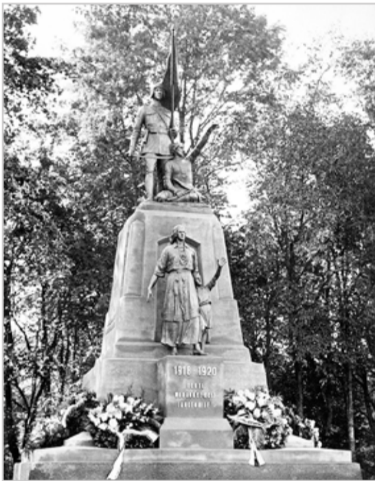
Vabadussõja mälestussammas (kujur Amandus Adamson) mille taastamiseks on algatatud ülmaineline annetuste kogumine.

Põltsamaa kihelkond on ajaloolise Viljandimaa osa ning Viljandimaa loeb tegelikult senini meid oma Põhja-Viljandimaa osaks, vaatamata nõukogudeaegsetele piirimuudatustele.