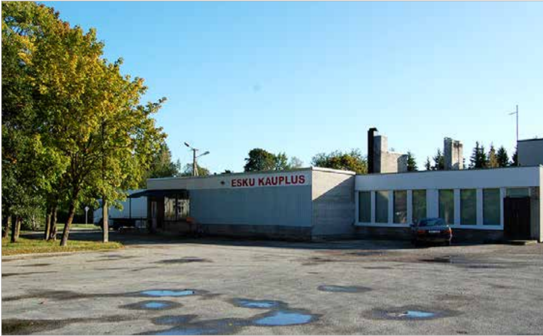
Esku kauplus Põltsamaa vallas