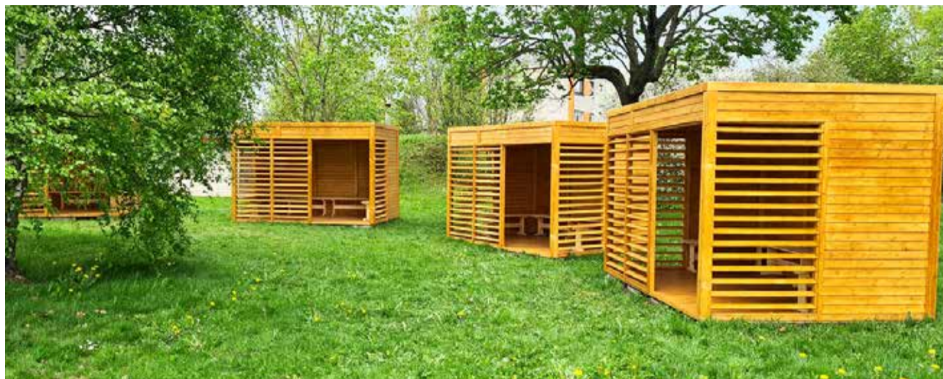
Põltsamaa Ühisgümnaasium sai 2021. aasta eelarvest õuesõppemajakesed.