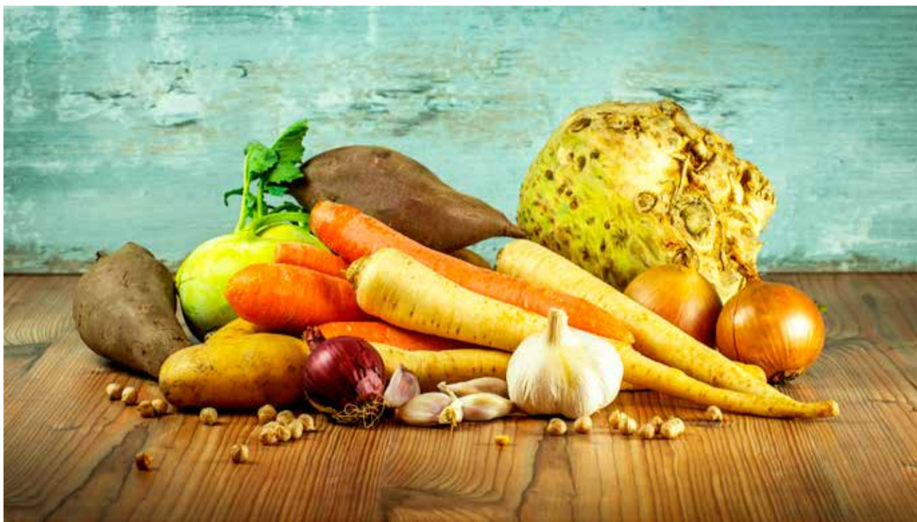
Otse Tootjalt Tarbijale kaubakohtumise üheks eeliseks on võimalikult lühike tarneahtel.