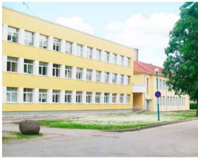
Põltsamaa Ühisgümnaasiumi Lille tänava koolihoone.