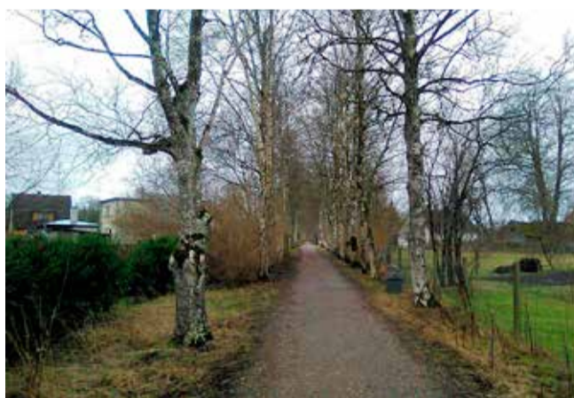
Põltsamaal asendatakse väga halvas seisus puud uutega.

„Puistu alleilmelisus on säilinud Pargi-Tamme