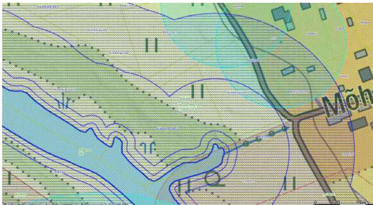
Joonis 3. Piirkonna olulisemate maakasutuse piirangutega.