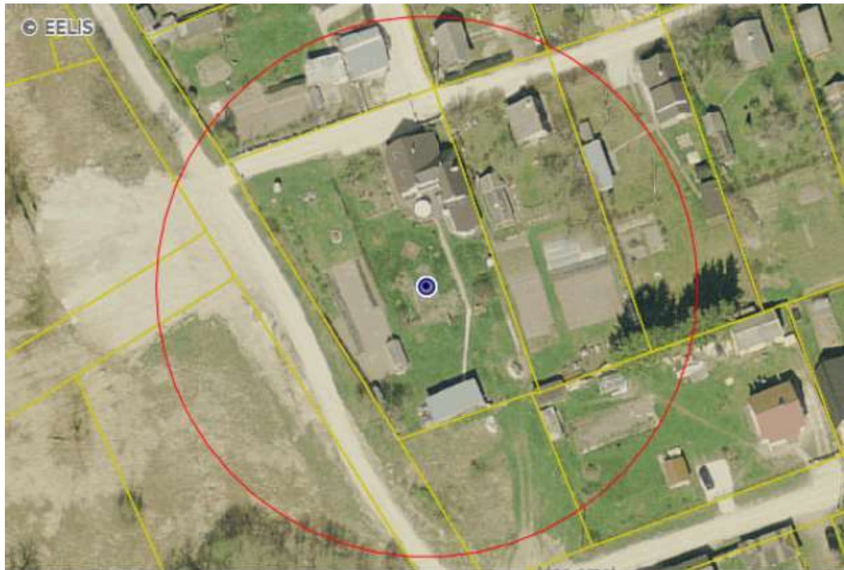
Joonis 4. Puurkaev nr 18296.

Põltsamaa vallas Mällikvere külas kinnistute Kullerkupu tee 1 ja Kullerkupu tee 3 DP KSH eelhinnang