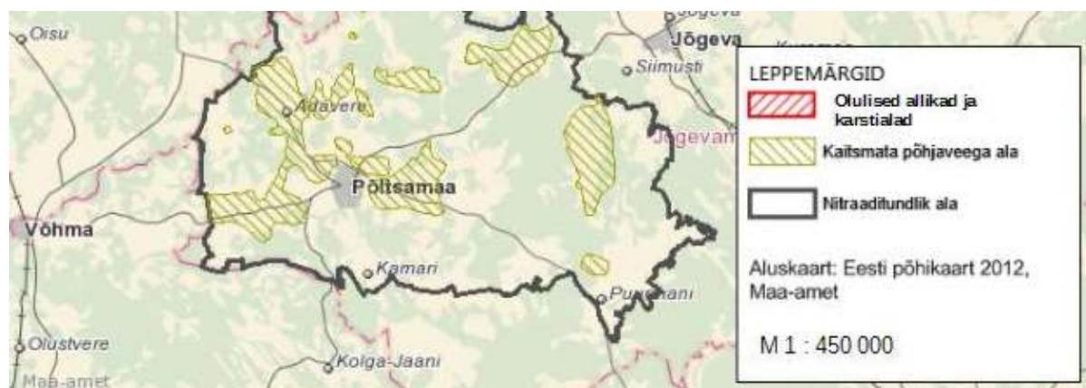
Joonis 6. Põltsamaa valla põhjavee kaitstus.

Pandivere ja Adavere-Põltsamaa nitraaditundlikul alal (kogupindalaga 3250 km 2 ) kehtib Vabariigi Valitsuse poolt kehtestatud ala kaitse-eeskiri. Nitraaditundlikuks loetakse ala, kus põllumajanduslik tegevus on põhjustanud või võib põhjustada nitraatioonisisalduse põhjavees üle 50 mg/l või mille pinnaveekogud on põllumajanduslikust tegevusest tingituna eutrofeerinud või eutrofeerumisohus. Tegemist on looduslikult kaitsmata põhjaveega alaga (vt joonis 6). Nitraaditundlikud alad määratakse aga eeskätt intensiivse põllumajandustootmisega piirkondade põhja- ja pinnavee kaitseks. Nimetatud ala kaitse-eeskiri seab eelkõige piiranguid maaharimisele ja väetamisele ning ei sea piiranguid kavandatava tegevuse suhtes. Antud juhul kavandatakse elamuala koos kaasaegse infrastruktuuriga.