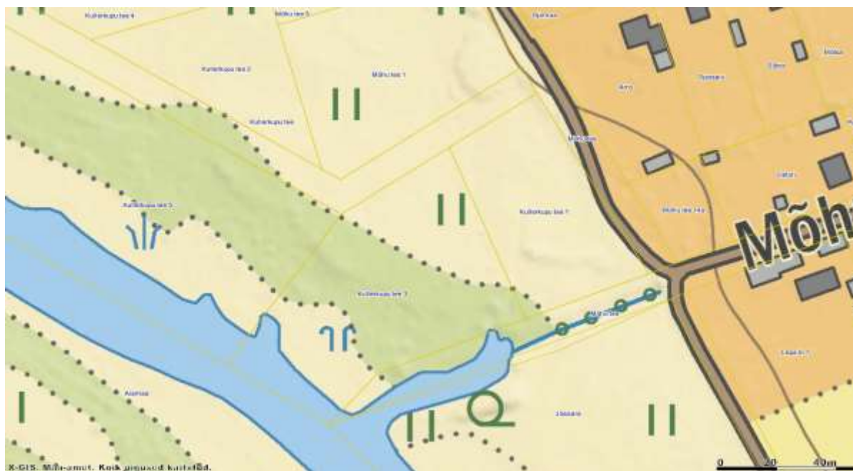
Joonis 2. Olemasolev olukord.

Põltsamaa Vallavalitsus on nimetatud planeeringu alusel esitanud Keskkonnaametile taotluse ehituskeeluvööndi vähendamiseks Kullerkupu tee 1 ja Kullerkupu tee 3 katastriüksustel, kuna pärast kehtestamist selgus, et kuigi kruntidele on maakasutuse sihtotstarbeks määratud elamumaa, ei ole võimalik sinna ehitada, sest kruntidega piirnev Põltsamaa jõe sopp (maaparanduskraav) on formaalselt jõe osaks, millest tulenevalt kehtib seal samuti ehituskeeluvöönd laiussega 50 m (vt joonis 3).