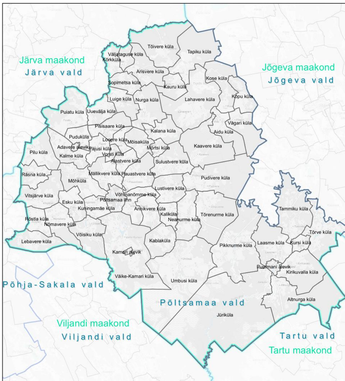
Joonis 1. Üldplaneeringuga hõlmatav ala – Põltsamaa valla asustusüksused.

Üldplaneering koostatakse kogu Põltsamaa valla territooriumile (joonis 1).