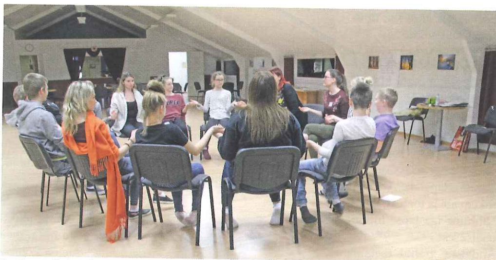
Kuningamäe kardiraja spordihoone saalis harjutati praktiliselt, kuidas mängu korraldada.