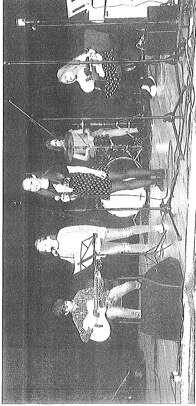
Esimene esinemine oli raske, aga kõik said kenasti hakkama.

Ilma õppimata ei saa mitte kellegist meistrit. Kohe uuel aastal Puurmani rahvamajas sündmus, mis kandis nime meistriklasi ja mille kestvuseks oli neli päeva. Meistriklasi õpe oli mõeldud ühinenud Põltsamaa valla ja Kolga-Jaani muusikahuvilistele noortele ning tähendas teisisõnu nelja päeva täis muusikat – tantsu, laulu ja pillimängu.